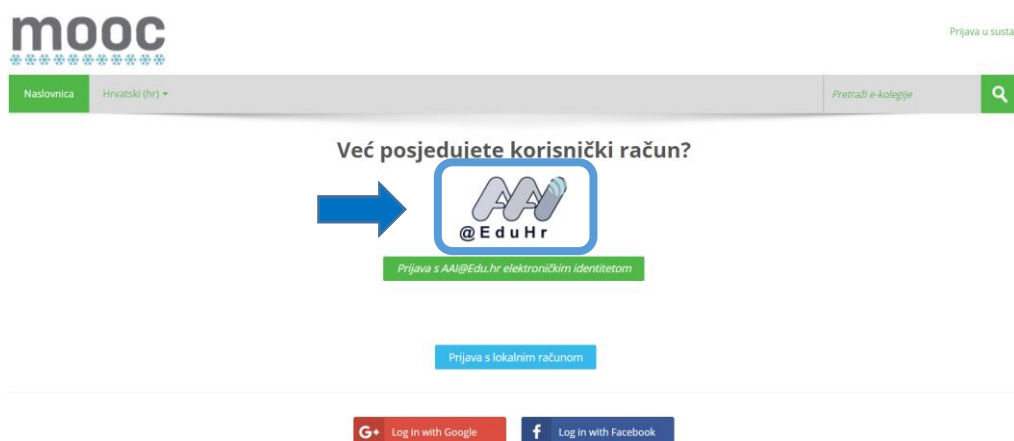
Slika 2: prijava pomoću AAI@EduHr identiteta u sustav MOOC ( https://mooc.carnet.hr )